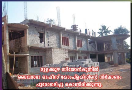
മുളക്കുഴ സീതോൻകുനിൽ ദൈവസഭാ ഓഫീസ് കോംപ്ലക്സിന്റെ നിർമ്മാണം പുരോഗമിച്ചു കൊണ്ടിരിക്കുന്നു.