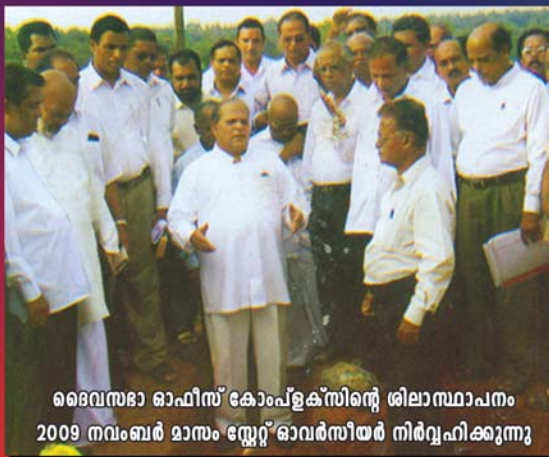
ദൈവസഭാ ഓഫീസ് കോംപ്ലക്സിന്റെ ശിലാസ്ഥാപനം 2009 നവംബർ മാസം സ്റ്റേറ്റ് ഓവർസിയർ നിർവ്വഹിക്കുന്നു