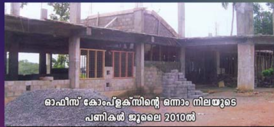
ഓഫീസ് കോംപ്ലക്സിന്റെ ഒന്നാം നിലയുടെ പണികൾ ജൂലൈ 2010ൽ