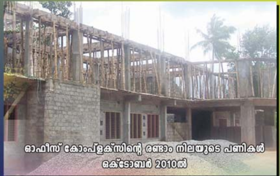
ഓഫീസ് കോംപ്ലക്സിന്റെ രണ്ടാം നിലയുടെ പണികൾ ഒക്ടോബർ 2010ൽ