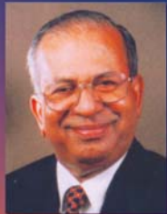
റവ. പി.എ.വി. സാ