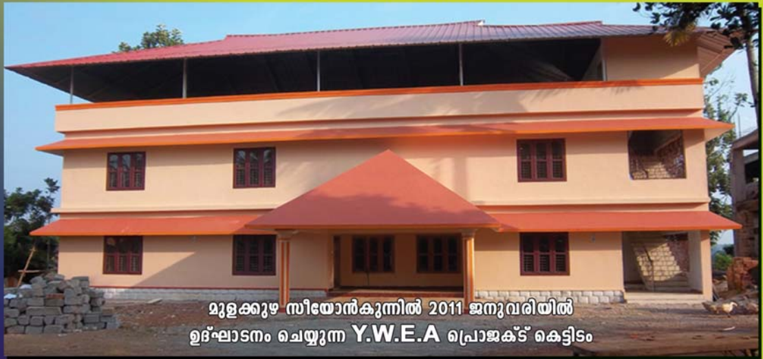
മുളക്കുഴ സീതോൻകുനിൽ 2011 ജനുവരിയിൽ ഉദ്ഘാടനം ചെയ്യുന്ന Y.W.E.A പ്രൊജക്ട് കെട്ടിടം