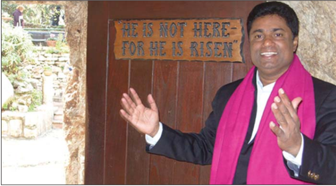
"അവൻ ഉയിർത്തെഴുന്നേറ്റു. അവൻ ഇവിടെ ഇല്ല; അവനെ വെച്ച സ്ഥലം ഇതാ" യെരൂശലേമിൽ യേശുവിനെ അടക്കം ചെയ്ത കല്ലറയ്ക്ക് സമീപം അച്ചൻകുത്ത് ഇലനൂർ