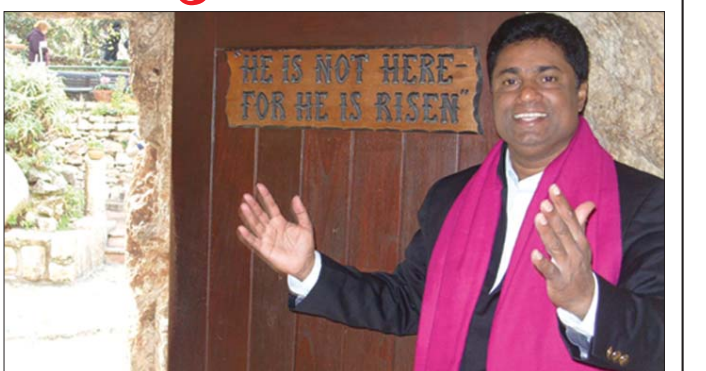
"അവൻ ഉയിർത്തെഴുന്നേറ്റു; അവൻ ഇവിടെ ഇല്ല; അവനെ വച്ച സ്ഥലം ഇതാണ്" യെരൂശലേമിൽ യേശുവിനെ അടക്കം ചെയ്ത കല്ലറയ്ക്ക് സമീപം അച്ചൻകുത്ത് ഇലന്തൂർ

എല്ലാ മാസവും ട്രൂകുകൾ >> സ്റ്റാർ ഹോട്ടലുകളിൽ താമസം >> മുന്നേറുമ്പോൾ വിവേകമയമായ ഭക്ഷണം >> മികച്ചയാത്രാ സൗകര്യങ്ങൾ >> ഷോപ്പിംഗ് അവസരങ്ങൾ >> ആത്മീയ ചിന്തകൾ ഉണർത്തുന്ന പഠനങ്ങളും ആശ്വാസനായും >> പ്രഗത്ഭരായ ഗൈഡുകളുടെ സേവനം. >> ഗൾഫ്, അമേരിക്ക, ഇംഗ്ലണ്ട് എന്നീ രാജ്യങ്ങളിൽ നിന്നും നേരിട്ടു ട്രൂകുകൾ. >> എല്ലാ സ്റ്റേറ്റുകളിൽ നിന്നും യാത്രകൾ. യെരൂശലേം യാത്രയ്ക്കുള്ള സീറ്റുകൾ ഉടൻ തന്നെ ഉറപ്പാക്കുക ഫോൺ: 0469 2634321 / 9847166994